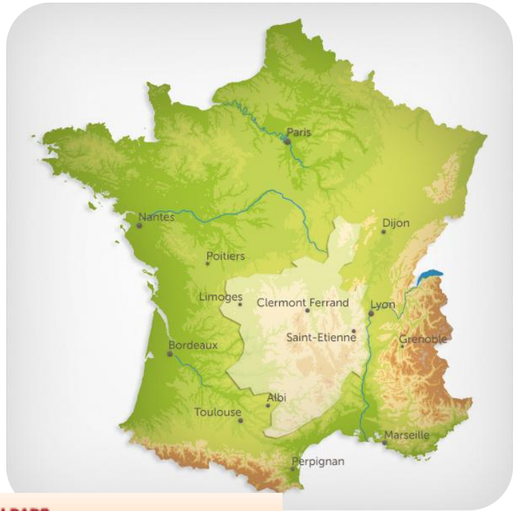
Plan de situation du PNR