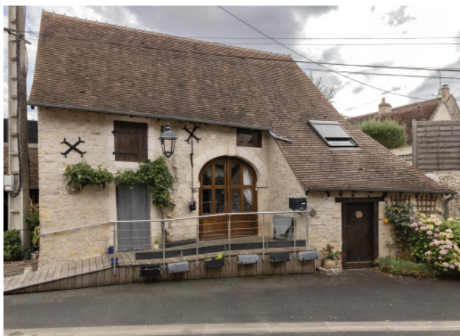
Étable des Gagnerons. Son entrée principale est dans le mur gouttereau est.