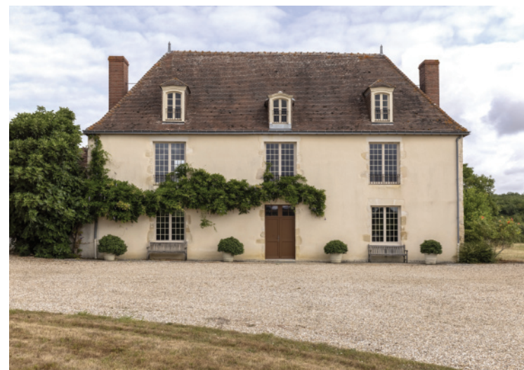
« Château » de l'Étang de Blanzay, gentilhomme construite à la fin du XVII e ou au XVIII e siècle.