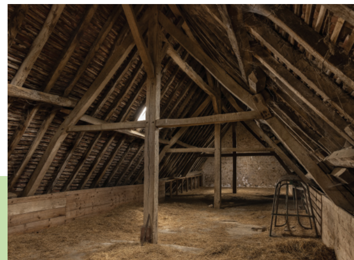
Charpente de l'étable.