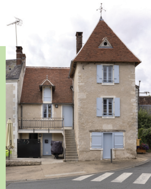
Maison dite « le Pavillon ». Elle comprend une petite boutique en rez-de-chaussée et, au dessus, un logement, sur deux niveaux, desservi par un escalier extérieur.

Pendant la guerre de Cent Ans, les châteaux de la Tour et de Buchignoux sont un temps occupés par les Anglais qui rançonnent leur propriétaire. Dans le bourg, une inscription portée sur le « Pavillon », maison en forme de petite tour carrée construite (ou reconstruite) en 1603, évoque leur présence : « (...) CE LOGIS EST BATIE SUR UNE SALLE DU TEMPS DES ANGLAIS (...) ».