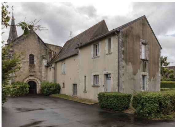
Église paroissiale Saint-Denis de Rivarennnes.