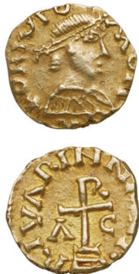
Avers et revers d'un triens en or portant l'inscription RIVARINNA. La monnaie a été produite entre, environ, 585 et 675.

Au vu de certaines données archéologiques, la question se pose, comme pour ce « camp du Gourde », dont l'enceinte de terre de près de 2 hectares domine, depuis une falaise, toute la vallée de la Creuse. La fonction exacte (politique ? militaire ?) de ce site, daté de la fin de l'Âge du fer, nous échappe. Il y a aussi les vestiges d'un présumé sanctuaire antique - dont les fragments d'une statue monumentale de Mercure - découverts dans un puits non loin du bourg. Enfin, le nom de Rivarennnes (RIVARINNA), inscrit sur des triens mérovingiens paraît être, au VII e siècle, celui d'un centre de collecte de l'impôt puisque ces monnaies en or sont vraisemblablement frappées in situ par l'atelier qui suit les agents du fisc royal dans leurs tournées. Or, au très haut Moyen Âge, ces centres sont souvent les chefs-lieux des premières et vastes paroisses du Berry. Plus tard, au XI e siècle, des seigneurs limousins autorisent l'abbaye de Lesterps à fonder, sur les terres qu'ils possèdent à Rivarennnes, un prieuré. Au XII e siècle, l'église Saint-Denis est construite à proximité.